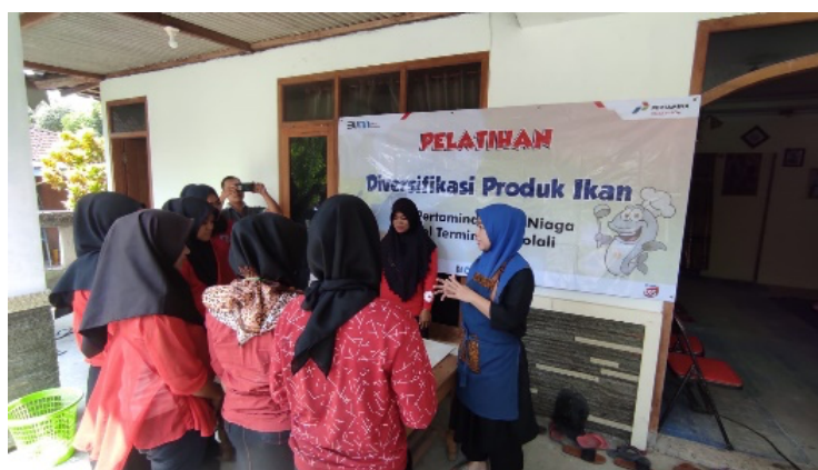
Foto 1. Pelatihan Diversifikasi Produk Ikan