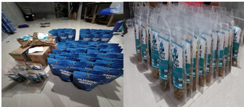
Foto 3. Produk Jawak dalam Kemasan

Dengan kemasan yang menarik produk ini jelas memiliki nilai jual yang baik. Produk ini dapat dijadikan produk oleh-oleh bagi para wisatawan yang berkunjung ke Kabupaten Boyolali.