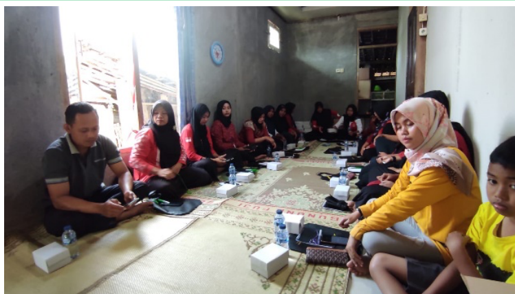
Foto 6. Kegiatan Monitoring Program

Dari kegiatan monitoring yang ini diketahui bahwa saat ini perempuan nelayan Desa Sarimulyo telah aktif memproduksi produk Jawak yang kemudian meningkatkan nilai jual hasil tangkap ikan. Hal ini membuat mereka tidak lagi bergantung dengan tengkulak, karena saat harga ikan murah mereka dapat menyimpan ikan untuk kemudian di produksi menjadi produk jawak.