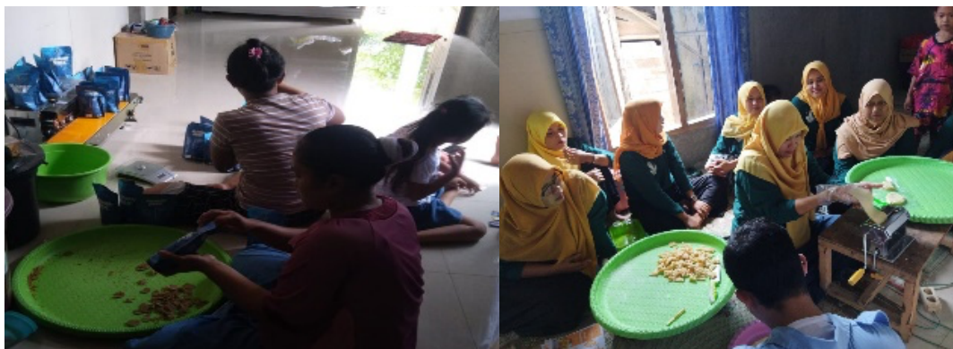
Foto 2. Proses Pembuatan Produk Jawak

Dalam produksi ini juga pendekatan CSR triple bottom line diimplementasikan sekaligus menerapkan CSV perusahaan. Produksi produk jawak memperhatikan dari segi lingkungan dimana terdapat inovasi alat masak kompor hemat energi yang membuat penggunaan bahan bakar gas lebih efisien. Selain itu ikan asap yang biasanya memerlukan kayu bakar kini dengan adanya inovasi Alat Pengasap Ikan (APIKAN) penggunaan kayu bakar diganti menggunakan briket yang lebih ramah lingkungan.