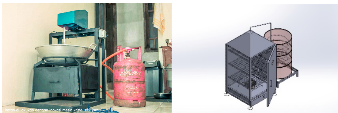
Gambar 3. Kompor Hemat Energy dan APIKAN

Dalam produksi ini juga pendekatan CSR triple bottom line diimplementasikan sekaligus menerapkan CSV perusahaan. Produksi produk jawak memperhatikan dari segi lingkungan dimana terdapat inovasi alat masak kompor hemat energi yang membuat penggunaan bahan bakar gas lebih efisien. Selain itu ikan asap yang biasanya memerlukan kayu bakar kini dengan adanya inovasi Alat Pengasap Ikan (APIKAN) penggunaan kayu bakar diganti menggunakan briket yang lebih ramah lingkungan.