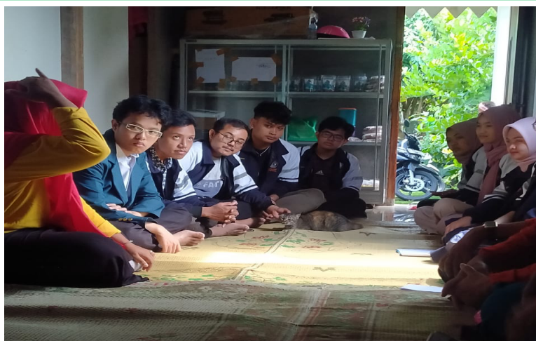
Foto. 4 Kunjungan Mahasiswa Undip

Saat ini Dapur Jawak yang merupakan basecamp UMKM Jawak menjadi tempat pembelajaran bagi siswa-siswi sekolah sekitar. Terlihat dari awal terbentuk tahun 2022 hingga awal tahun 2023 ini telah terdapat 176 orang yang memperoleh pembelajaran dari kegiatan wirausaha jajanan iwak. Kegiatan pembelajaran wirausaha di kelompok ini masih gratis bagi siapapun karena mereka ingin mengenalkan terlebih dahulu produk mereka ke masyarakat luas. Namun begitu tidak menutup kemungkinan kedepan mereka akan membuat paket wisata edukasi bagi masyarakat untuk memperoleh pengetahuan proses wirausaha kelompok.