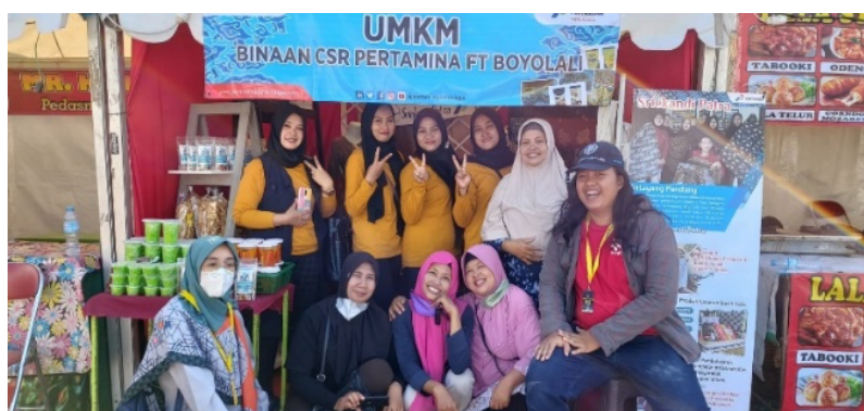
Foto 5. Kegiatan Pameran Produk Jawak

Saat ini Dapur Jawak yang merupakan basecamp UMKM Jawak menjadi tempat pembelajaran bagi siswa-siswi sekolah sekitar. Terlihat dari awal terbentuk tahun 2022 hingga awal tahun 2023 ini telah terdapat 176 orang yang memperoleh pembelajaran dari kegiatan wirausaha jajanan iwak. Kegiatan pembelajaran wirausaha di kelompok ini masih gratis bagi siapapun karena mereka ingin mengenalkan terlebih dahulu produk mereka ke masyarakat luas. Namun begitu tidak menutup kemungkinan kedepan mereka akan membuat paket wisata edukasi bagi masyarakat untuk memperoleh pengetahuan proses wirausaha kelompok.