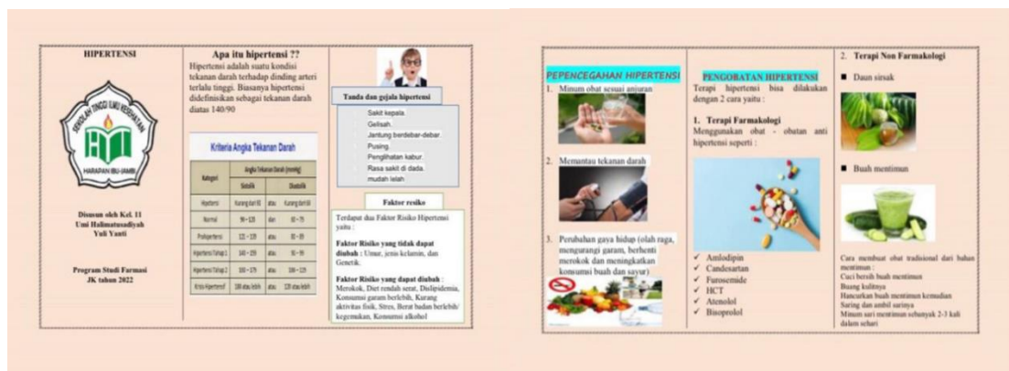
a. Bagian Depan

Setelah melakukan skrinning penyakit, tim KKN mempersiapkan keperluan untuk melakukan penyuluhan guna meningkatkan pengetahuan masyarakat terhadap penyakit hipertensi serta memberikan edukasi kepada masyarakat tentang cara pengobatan dan cara memanfaatkan buah mentimun untuk dijadikan produk herbal untuk mengatasi hipertensi. Setelah itu memberikan solusi pengobatan dan pencegahan penyakit hipertensi. Media informasi yang digunakan pada kegiatan penyuluhan ini adalah leaflet.