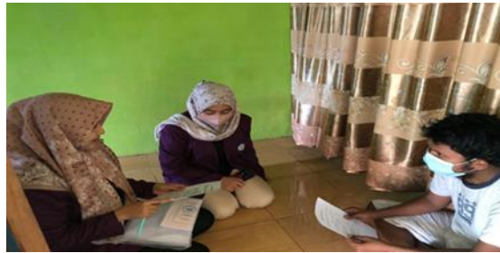
Gambar 1. Melakukan skrinning Penyakit di RT 04 Kel.Bagan Pete

Setelah melakukan skrinning penyakit, tim KKN mempersiapkan keperluan untuk melakukan penyuluhan guna meningkatkan pengetahuan masyarakat terhadap penyakit hipertensi serta memberikan edukasi kepada masyarakat tentang cara pengobatan dan cara memanfaatkan buah mentimun untuk dijadikan produk herbal untuk mengatasi hipertensi. Setelah itu memberikan solusi pengobatan dan pencegahan penyakit hipertensi. Media informasi yang digunakan pada kegiatan penyuluhan ini adalah leaflet.