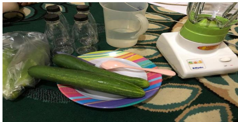
Gambar 4. Pembuatan obat herbal sari mentimun

Tahapan terakhir adalah evaluasi hasil dari penyuluhan yang telah dilakukan yaitu membagikan kertas kuisisioner kepada masyarakat sebelum dan sesudah dilakukan penyuluhan terkait penyakit hipertensi (Gambar 5).