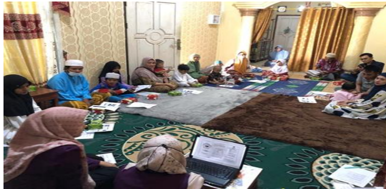
Gambar 3. Pelaksanaan penyuluhan mengenai hipertensi