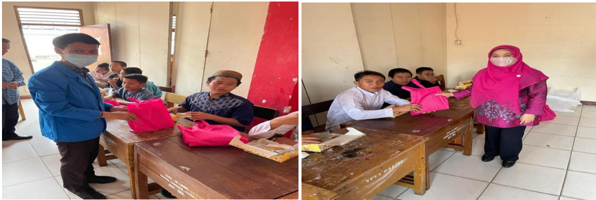
Gambar 5. Pembagian Goody Bag dan Sovenir