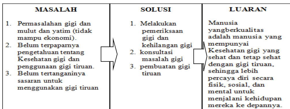
Gambar 1. Alur Kegiatan Program Program Kemitraan Masyarakat

Target luaran Program IPTEKS bagi masyarakat, yaitu terdapat perbaikan pada kualitas masyarakat berdasarkan parameter yang terukur secara kuantitatif. Berikut adalah alur kegiatan program kemitraan masyarakat.