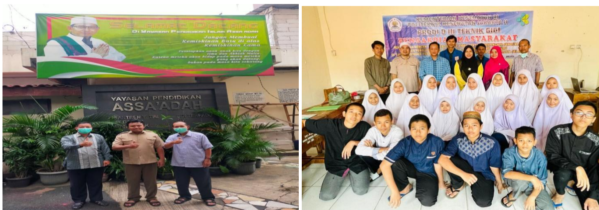
Gambar 4. Foto Bersama dengan Pengurus dan Siswa Pondok Pesanren

Berdasarkan hal-hal tersebut dapat dikatakan bahwa video animasi lebih efektif untuk meningkatkan pengetahuan mengenai pentingnya penggunaan gigi tiruan. Video animasi ini tepat digunakan sebagai media edukasi karena menampilkan unsur teks, gambar, suara yang menarik sehingga dapat menarik perhatian dan membantu memberikan pemahaman pada pentingnya penggunaan gigi tiruan yang jarang terbayangkan. Video animasi mempunyai kelebihan yang bisa membantu dalam pemahaman pada pentingnya penggunaan gigi tiruan. Edukasi dengan menggunakan video animasi dapat melibatkan indera penglihatan dan pendengaran sehingga lebih mudah memperoleh pengetahuan melalui gambar dan suara. (Widiyasanti M, dkk 2018) Sedangkan, leaflet tidak menampilkan gerak dan suara. (Saputra A, dkk. 2019)