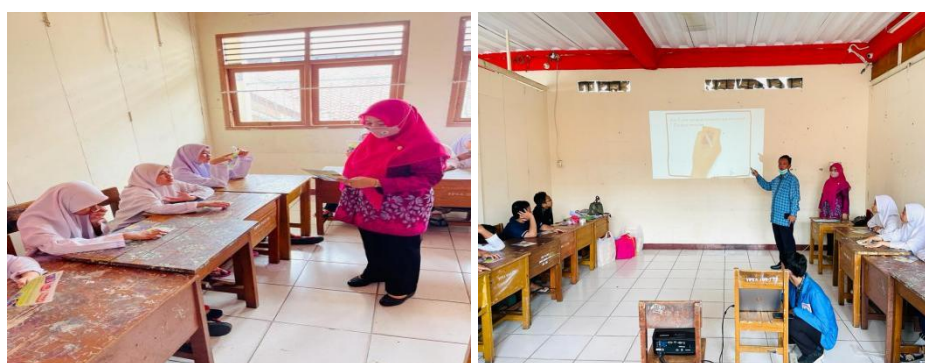
Gambar 2. Pelaksanaan Penyuluhan dengan Media Leaflet dan Media Video Animasi

Kegiatan pengabdian masyarakat tahap pertama adalah dilakukan Pre-test dilanjutkan dengan penyuluhan tentang pengetahuan kesehatan gigi mulut penggunaan dan pembuatan gigi tiruan yang selanjutnya dilakukan Pre-test sebelum penyuluhan dan Post-test setelah penyuluhan. Hal ini bertujuan untuk mengetahui dan mengukur keberhasilan program penyuluhan tersebut.