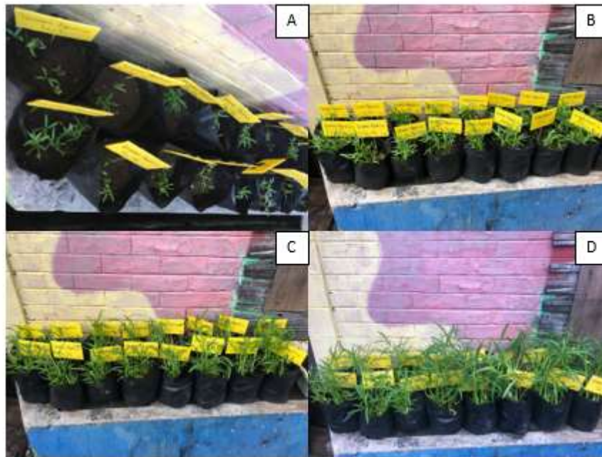
Gambar 9. Hasil pertumbuhan tinggi tanaman kangkung ( Ipomea aquatica ) (A) minggu pertama; (B) minggu kedua; (C) minggu ketiga; dan (D) minggu keempat pada 2 media tanam berbeda

Pemanfaatan Limbah Tempe Menjadi Media Tanam dan Pupuk Organik Cair (Poc) yang Bernilai Ekonomi di Kelurahan Putat Jaya