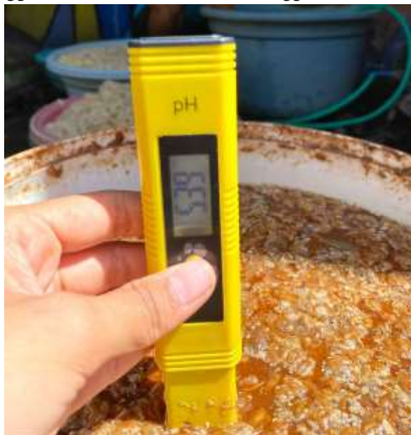
Gambar 6. Proses mengukur PH POC secara rutin