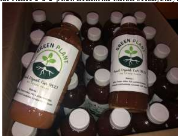
Gambar 8. Kemasan POC yang siap dijual