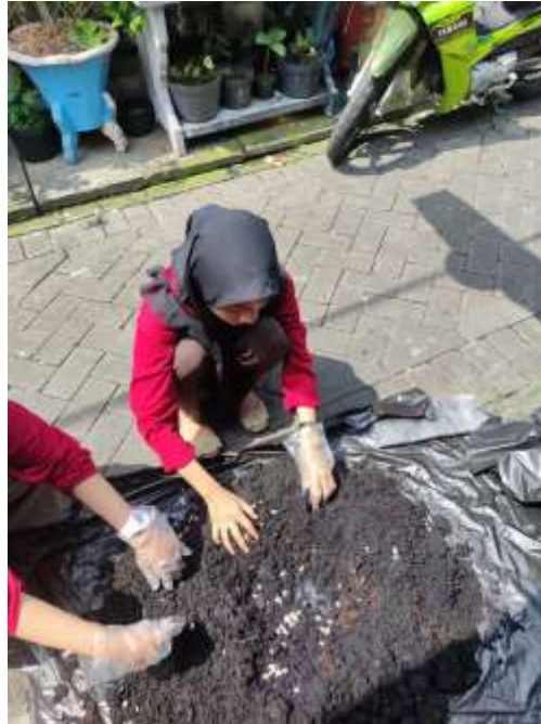
Gambar 2. Proses pencampuran tanah dan kulit kedelai

Pemanfaatan Limbah Tempe Menjadi Media Tanam dan Pupuk Organik Cair (Poc) yang Bernilai Ekonomi di Kelurahan Putat Jaya