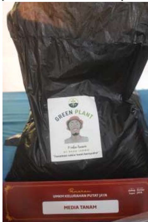
Gambar 3. Kemasan media tanam yang siap dijual