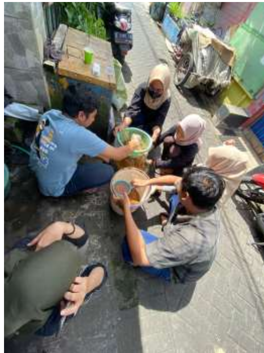
Gambar 7. Proses penyaringan POC

Pemanfaatan Limbah Tempe Menjadi Media Tanam dan Pupuk Organik Cair (Poc) yang Bernilai Ekonomi di Kelurahan Putat Jaya