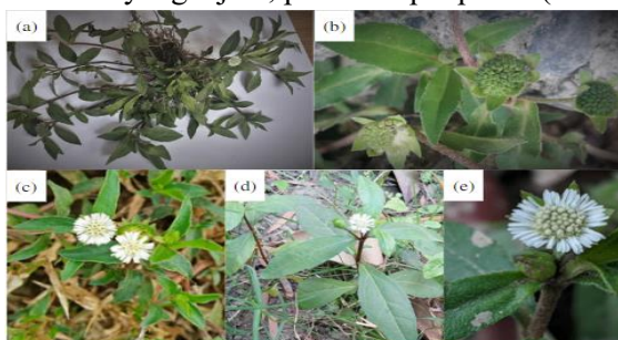
Gambar 1. (a) keseluruhan tanaman E. alba ; (b) buah E. alba ; (c-e) bunga dan kuncup E. alba (Sherchan et al., 2021); (Timalsina & Devkota, 2021)